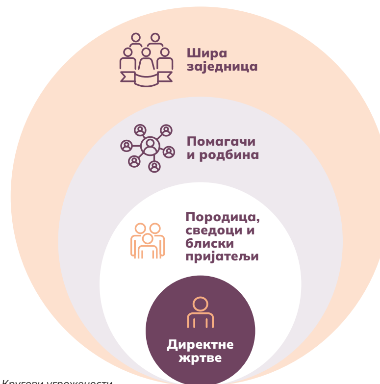
Слика 2. Кругови угрожености

Како би се установа што пре вратила у режим редовног функционисања, потребно је да се установи пружи подршка правовремено и на стручан начин.