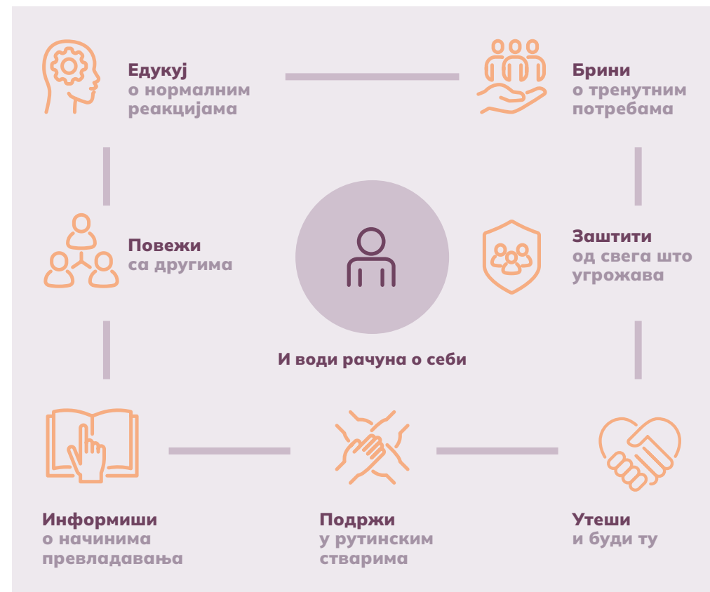
Слика 1. Задаци психолошке прве помоћи